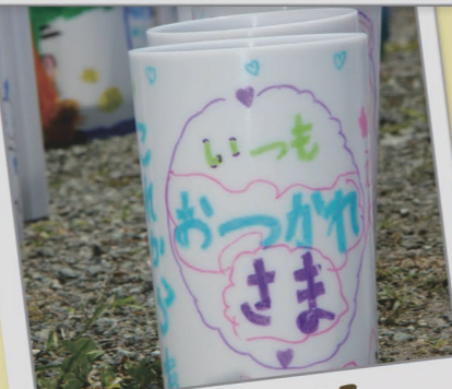
8月 灯想夜2017 いつもありがとう♡