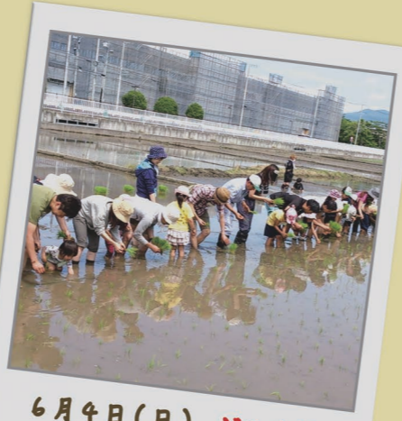
6月4日(日) どろんこ田植え合戦!