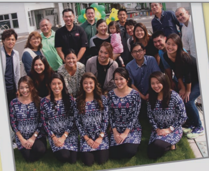
10月 国際交流体験 ホノルルの皆様をおもてなし