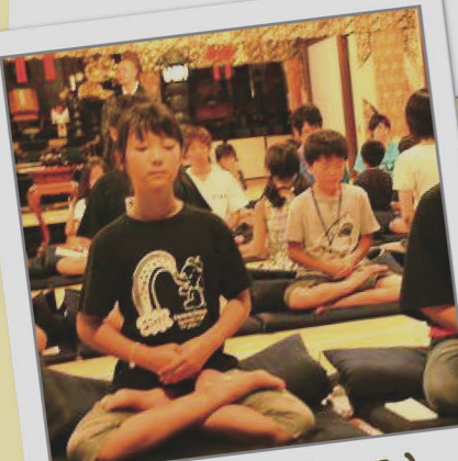
6月24・25日(土・日) お寺で合宿! 修行じゃ〜