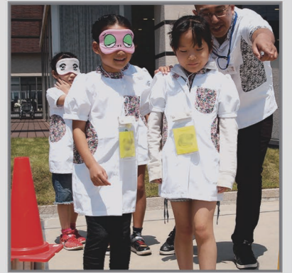
9月 恵まれた心身に感謝 敬老の日

地域の宝である子どもたちを、立場という垣根を越えて共に育てさせていただく。その様な機会もまた「ありがとう」と素直に私たち大人も思い行動ができたとき、より良い地域と子どもたちを未来へ受け継ぐことが出来ると私たちは信じています。