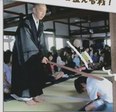
6月24・25日(土・日) お寺で座禅!と食育!