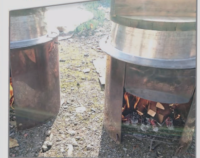
11月5日(日) お米の収穫祭