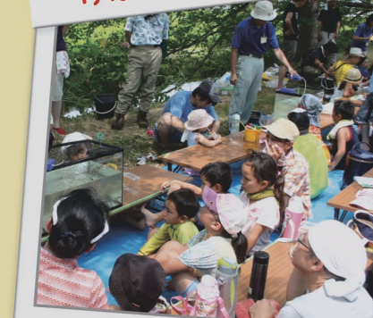
7月23日(日) 水中生物 夏の観察会!