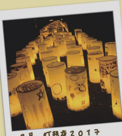
8月 灯想夜2017 ありがとうの思いを描こう